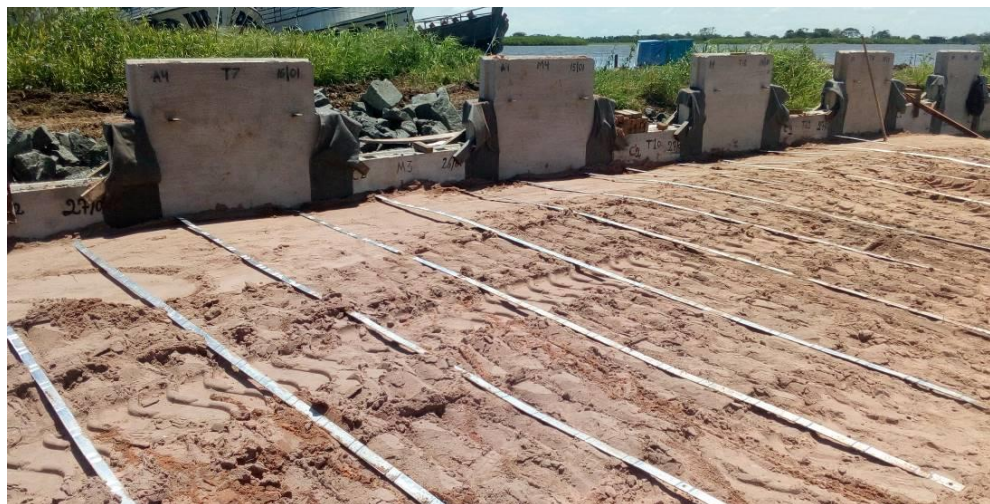
Fotos 19 e 20- Fornecimento, espalhamento e compactação de aterro

REPÚBLICA FEDERATIVA DO BRASIL ESTADO DO PARÁ PREFEITURA MUNICIPAL DE MONTE ALEGRE-PARÁ CNPJ: 04.838.496/0001-28