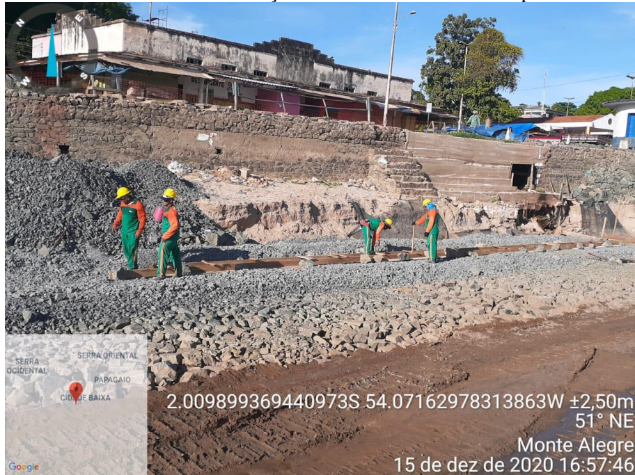
Fotos 07 e 08 - Execução de soleira em concreto simples

REPÚBLICA FEDERATIVA DO BRASIL ESTADO DO PARÁ PREFEITURA MUNICIPAL DE MONTE ALEGRE-PARÁ CNPJ: 04.838.496/0001-28