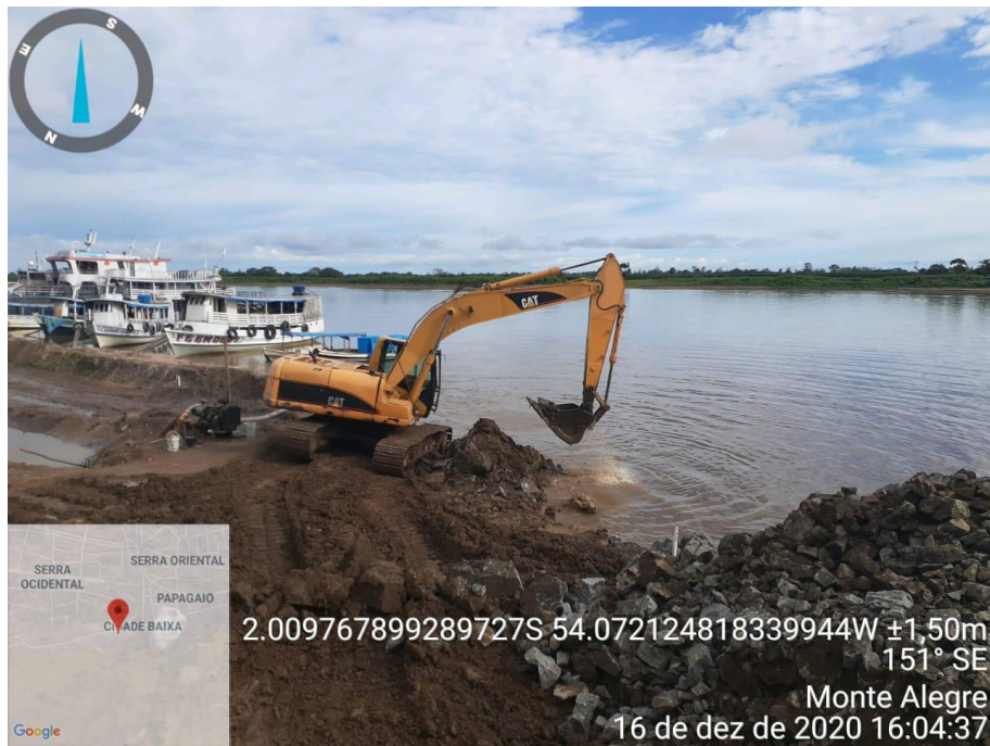
Foto 04- Execução de Dique de Contenção- Complemento TRECHO 01- Segmentos 09, 08 e 07

REPÚBLICA FEDERATIVA DO BRASIL ESTADO DO PARÁ PREFEITURA MUNICIPAL DE MONTE ALEGRE-PARÁ CNPJ: 04.838.496/0001-28