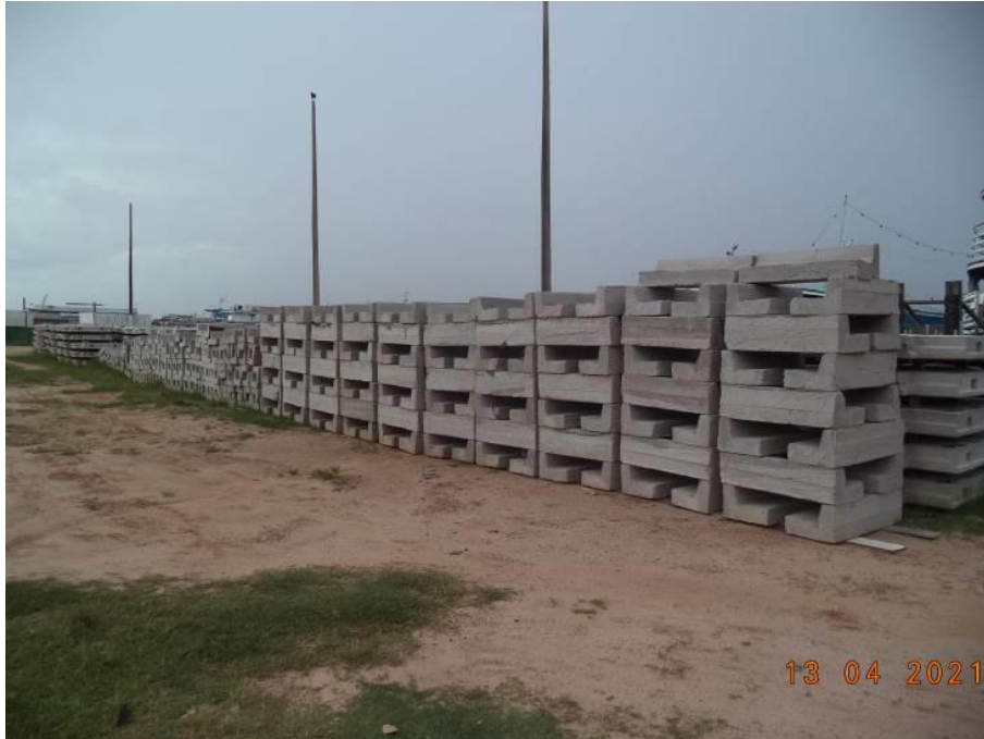
Fotos 29 a 31- Fabricação de meio fio e Poço de visita em concreto armado

REPÚBLICA FEDERATIVA DO BRASIL ESTADO DO PARÁ PREFEITURA MUNICIPAL DE MONTE ALEGRE-PARÁ CNPJ: 04.838.496/0001-28