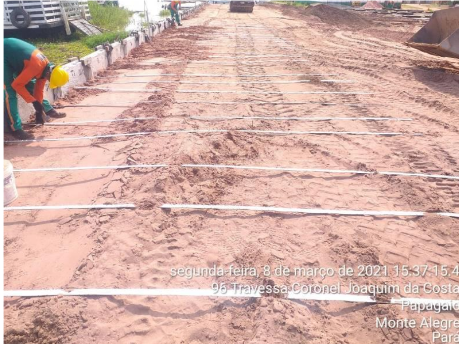
Fotos 27 e 28 - Montagem de placas, aterro e enrocamento externo

REPÚBLICA FEDERATIVA DO BRASIL ESTADO DO PARÁ PREFEITURA MUNICIPAL DE MONTE ALEGRE-PARÁ CNPJ: 04.838.496/0001-28